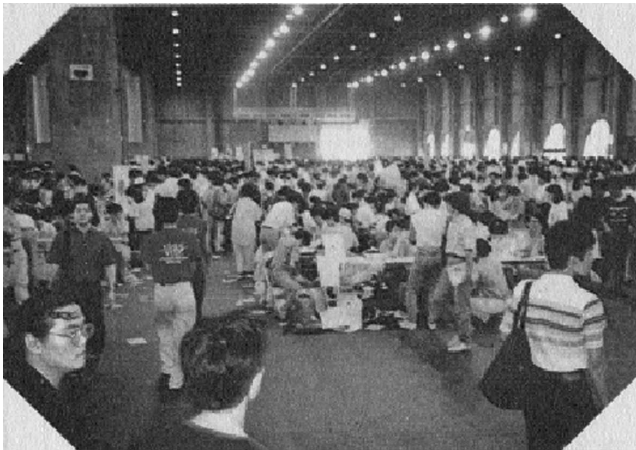
図4 雑誌に掲載された1989年8月のコミックマーケットの様子[4]