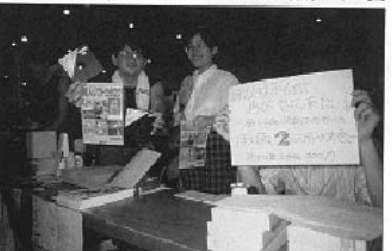
▲高値したばかりのソフトが売られるのもパソコンサークルの盛んなら。107

安の子連によるアノキロサークル、トルネード系だ。一方、男性系サークルでは種々の美少女系に對し、このところ、急激に、パソコン、ゲーム系サークルが増加しつつある。三年前には50に満たなかったことを考えると、現在300近くに増えあがったこのジャンルは、急成長しつつある新興勢力と見れないこともない。 男性系サークルは、今回13回、新館を中心に配置された。男性系創作マシ研、ファンタジー、SF、物語、美少女、ゲーム、コンピュータ、ファミコンといったジャンルが、1800近く集まった。——5万人以上の一般参加者のうち3割を占める男性の大半はこの場に流れていった。ファミコン、パソコンサークルに集まる若い手の中には、小、中学生の姿も