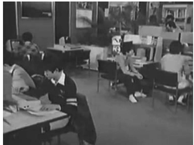
図2 マイコンショップでパソコンに触れる若者たち[2]