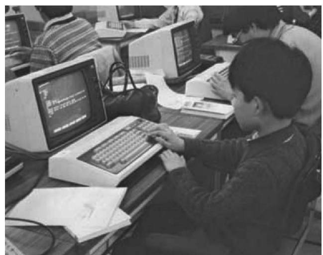
図3 マイコンショップでパソコンに触れる子供[3]