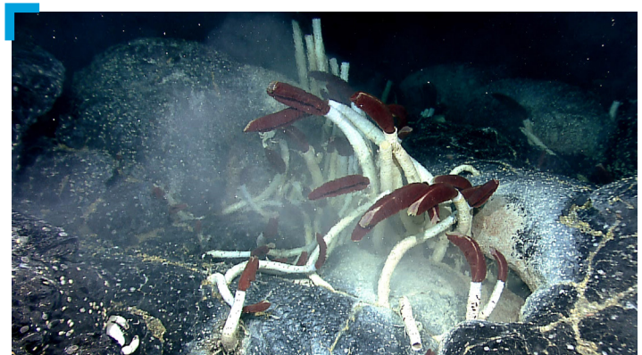
Una colonia de gusanos tubícolas de Riftia observada frente a la costa de las Islas Galápagos.