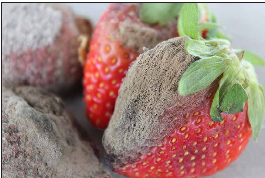
FIGURA 1. EL CRECIMIENTO MOHOSO GRIS A MARRÓN CLARO ES CARACTERÍSTICO DEL HONGO BOTRYTIS, CUBRIENDO LA PARTE INFECTADA DEL FRUTO DE LA FRESA.

Las infecciones de la fruta suelen aparecer como zonas blandas de color marrón claro en la superficie de la fruta (FIGURA 4), que se extienden rápidamente por toda la fruta