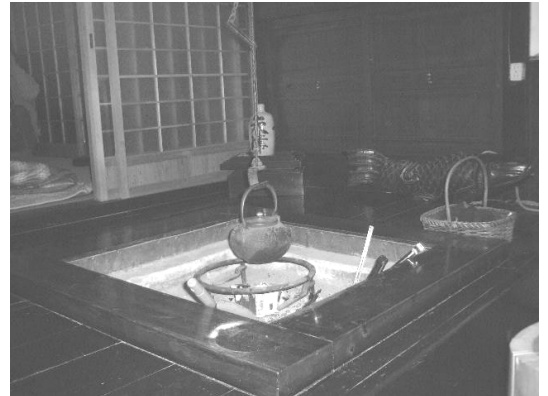
< 霧囲気サイコーの囲炉裏 >

さてこれで見学は終了…。なのですが、おまけをひとつ。私たちは10人ほどで泊まりがけで遊びに行ったのですが、泊まったのは金剛山のふもとの「民家」です。えっ？と思うでしょう？実はそこ、貸切で借りることができるんです。普段は、ちゃんとおうちの人がいて生活をしているみたいなのですが、希望があると貸してくれるそう。部屋は広くて、10人いても余裕余裕。しかも、本物の囲炉裏(いろり)があるんですよー！その晩は、炭をくべながら、囲炉裏を囲んで夜中まで語り明かしたのでした…(笑)