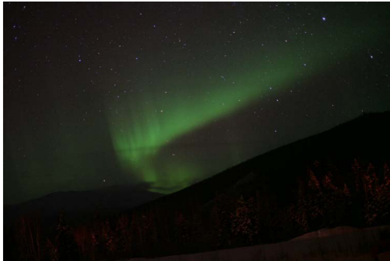
星空に舞うオーロラ

4 日目。観測最後の夜。23:30、昨日の監視小屋へ坂道を登る。今日は昨日に比べてすごく冷たい。外気に触れている頬が痛い。余りに美しい星空を数枚写真に収めた。すると、突如シャッターが閉まらなくなった。-30°Cの低温障害だ。アクティビティセンターまで撤退。センターの裏で待機。28日0:32、突如北の山の端に昨夜と同じような淡い白煙状。5分後消滅。幾度か生滅を繰り返して、1:17、濃緑色のカーテン状のオーロラが出現。徐々に色を増して立派なカーテン状に成長し、1:19、そのカーテンは降りた。この時ばかりは、この眼で観ている緑色のオーロラを 100km上空の天体現象とは思わなかった。