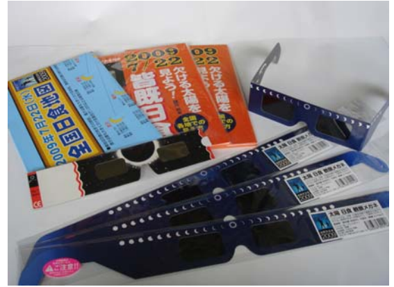
図7. 日食観察メガネ

岡山天文博物館には、太陽観察専用望遠鏡があり、安全に日食を観察できます。また、日食観察メガネも取り扱っております。