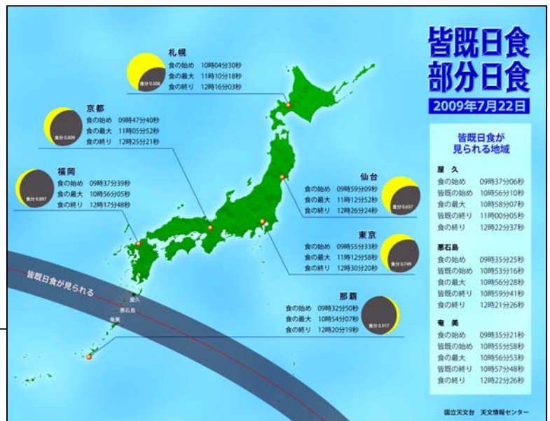
図5. 日本各地での日食の食分

今回、皆既日食が見られる範囲(皆既日食帯)に入る地域は、薩南諸島の種子島南端から屋久島、トカラ列島、そして、奄美大島の北部などです。最も条件の良いトカラ列島の悪石島では、10時53分から6分20秒の間、皆既日食を見ることができます。