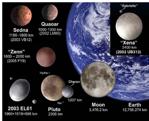
図. 主な太陽系外縁天体と地球および月の大きさの比較。

この4つの基準をすべてみたすものが惑星と定義され、現在、太陽から近い順番に水星、金星、地球、火星、木星、土星、天王星、海王星の8個の天体が惑星に分類されています。そして、このうち、3番目の「軌道上にほかの大きな天体がないもの」という点だけが満たされていない天体を、新しい分類の天体「準惑星」と定義することになり、太陽系外縁天体に属する冥王星とエリス、そして小惑星ケレスが準惑星に分類されました。その後、2008年7月に太陽系外縁天体のマケマケ、9月と同じく外縁天体のハウメアが追加され、現在、準惑星は