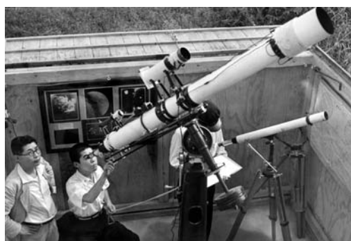
図1. 金光学園天文部の天文台の様子。