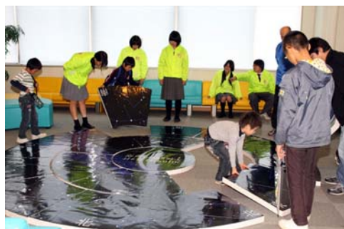
写真3. 3.8m 鏡のパズルに挑戦！ デカイ！