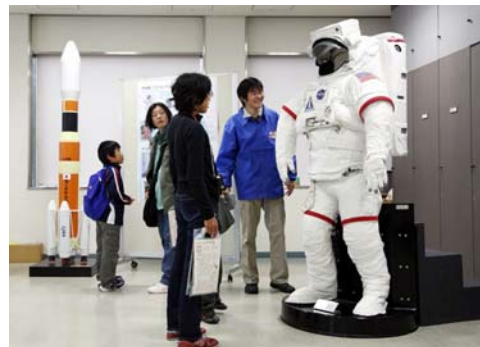
写真2. 憧れの宇宙服。実は後ろから中に 入れるんです。

てんじ てんたいかんそく れきし かんそく あき 展示コーナーでは、天体観測の歴史や、観測によって明らか になってきた最新の宇宙像を紹介した特別展『ガリレオの天体観測 から400年 宇宙の謎を解き明かす』が岡山で初公開。またみんな の憧れの宇宙服や宇宙開発ステーション・惑星探査機などのミニ チュア模型をはじめ、日本中を興奮させた小惑星探査機「はやぶ さ」に搭載されていたカメラの試作品も展示され、天文ファンの 心を驚つかみにしました。