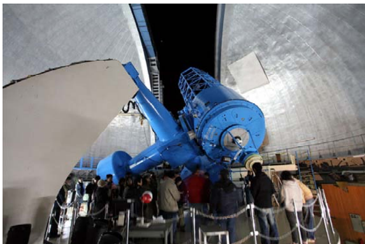
写真1. 188 cm望遠鏡で木星を観測中！

翌日11月7日（日）は、浅口市健康福祉センターが「一日科学館」大変身。市内外から約800人ものみなさんが遊びに来てくれました。