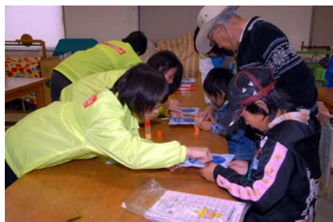
写真4. 星座早見盤を工作中。望遠鏡工作や バルーンアートも大盛況。

だいせいこう お ほしぞら うちゅう うれ 大成功に終わった『あさくち星空・宇宙フェスタ』。嬉しい ことに、ぜひ続けて欲しい！という声も届いています。も っと宇宙の魅力に触れてもらえるように、楽しいイベントを していきますので、ぜひリクエストなどもお寄せくださいね。