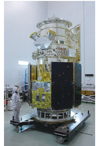
図1. 赤外線天文衛星「あかり」

今回の天文学入門講座は、その優れた能力で天文学に衝撃を与えた、日本初の赤外線天文衛星「あかり」について解説します。