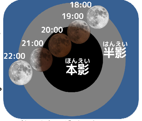
10月8日の月食のようす