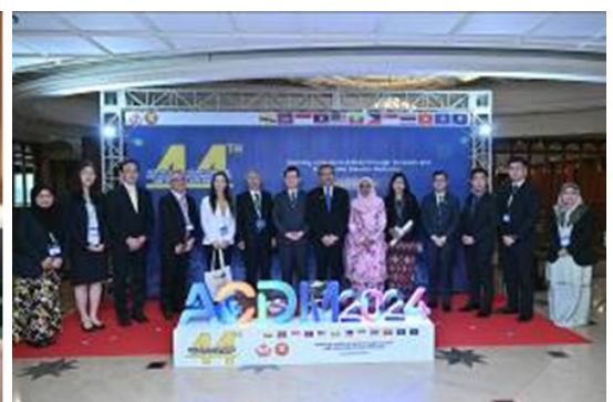
(справа) Памятное фото с Национальным центром по управлению стихийными бедствиями Брунея (NDMC)