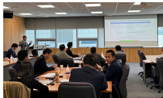
Проведение межрегионального диалога 2024

Азиатский Центр Снижения Рисков Стихийных Бедствий (ADRC) принял участие в межрегиональном диалоге 2024, посвященном теме «Инструменты и технологии оценки многофакторных рисков и раннего оповещения: обмен опытом между странами Азиатско-Тихоокеанского региона». Мероприятие проходило 27-29 мая 2024 года в городе Инчхон, Республике Корея. Организовано совместно Секретариатом Трехстороннего сотрудничества (TCS) и Офисом Управления ООН по снижению рисков бедствий в Северо-Восточной Азии & Глобальным Институтом образования и обучения (UNDRR ONEA & GETI) в поддержку инициативы «Раннее предупреждение для всех», которая была внедрена Генеральным секретарем ООН в 2022 году, чтобы обеспечить всеобщий охват системами раннего оповещения к 2027 году.