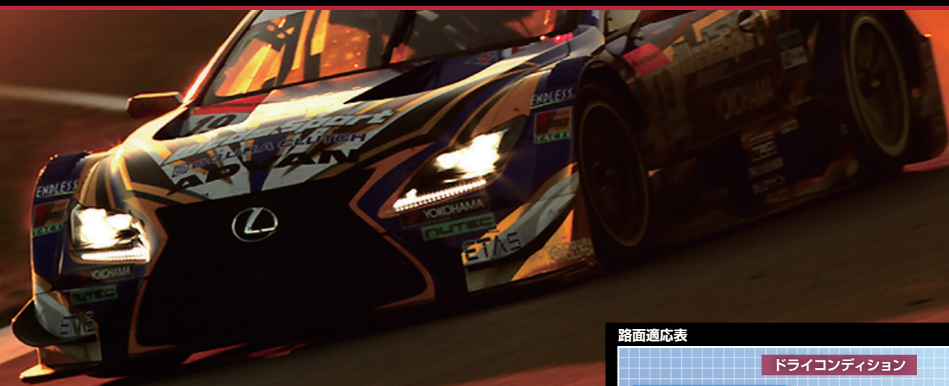
ADVAN A006 A006G/A006C