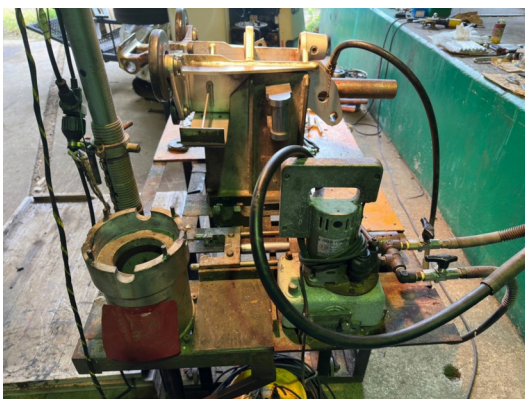
くまどー第1リフト握索機オーバーホール風景