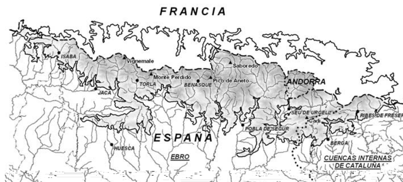
Figura 2. Detalle de la parte española de la región ecológica Pirineos

La región de los Pirineos queda delimitada por la zona pirenaica situada por encima de 1.000 m de altitud y comprende parte de la cuenca del Ebro y de las Cuencas Internas de Cataluña, según se detalla en la figura 2.