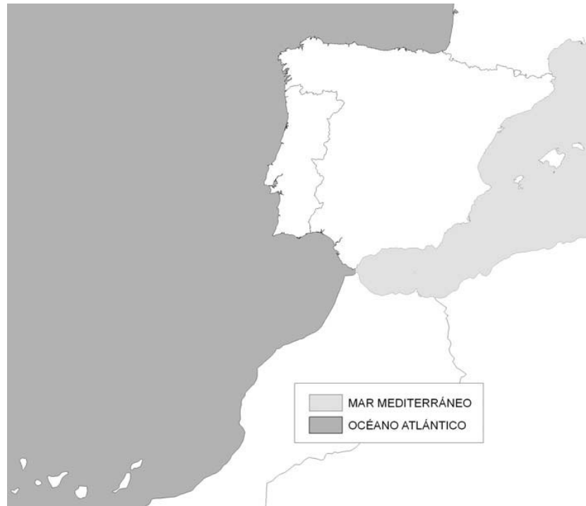
Figura 3. Regiones ecológicas de aguas de transición y costeras

Las regiones ecológicas de las aguas de transición y costeras serán el Océano Atlántico y el Mar Mediterráneo, como se muestra en la figura 3.