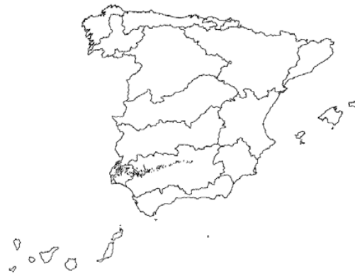
Tipo 6. Ríos silíceos del piedemonte de Sierra Morena