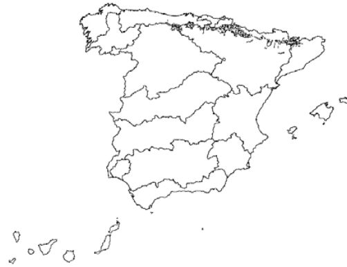
Tipo 26. Ríos de montaña húmeda calcárea