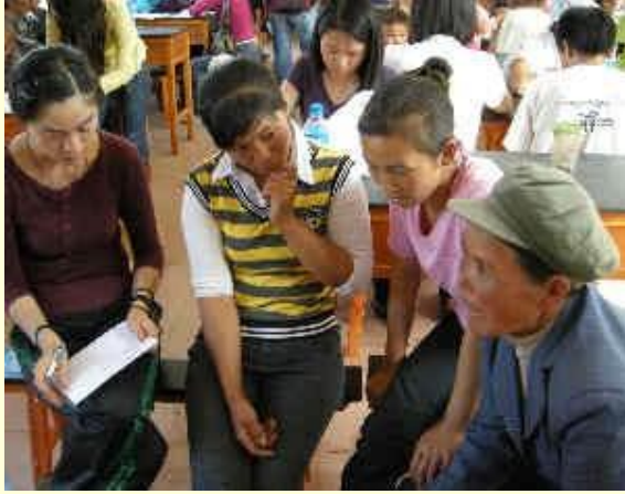
中国一些学生在考虑有关环境议题的输入资料

公民参与不单单是一件好事或该做的事；事实上它会形成更好的结果与治理。当以一种有意义的方式完成时，公民参与会造成两项重大效益：