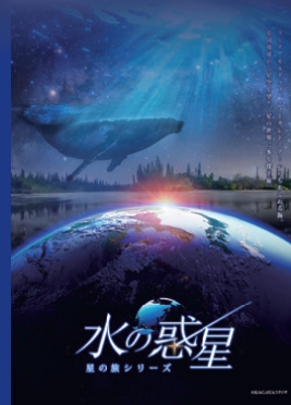
水の惑星／プラネタリウム