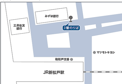
新松戸駅 3番乗り場