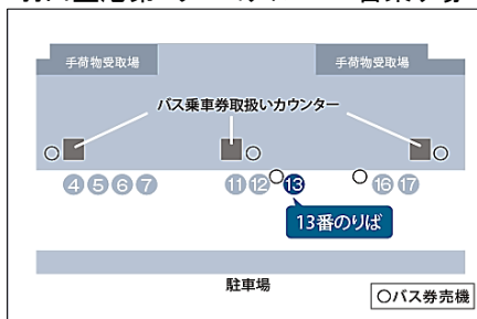
羽田空港第1ターミナル 13番乗り場