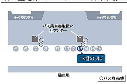
羽田空港第2ターミナル 13番乗り場