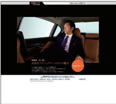
タイアップサイト1ページ目