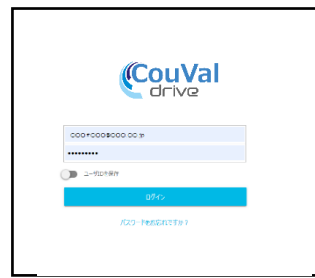
ログイン画面（イメージ）

コラボスペース （お客様用のフォルダがあるスペース）にアクセス お客様毎のフォルダ（4桁の番号を付与）のあるスペースです。接続元IPアドレス制御があるため、アクセスできるのは申請された御社ユーザ様と、NTTPCの御社担当のみのセキュリティを確保したフォルダをご提供します。