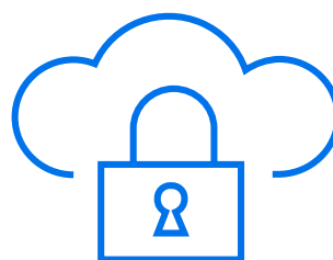
On-Premise oder Hosting-Partner