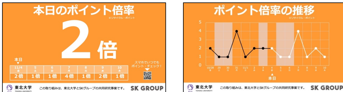
図 2. 資源回収ステーションにおけるポイント掲示イメージ