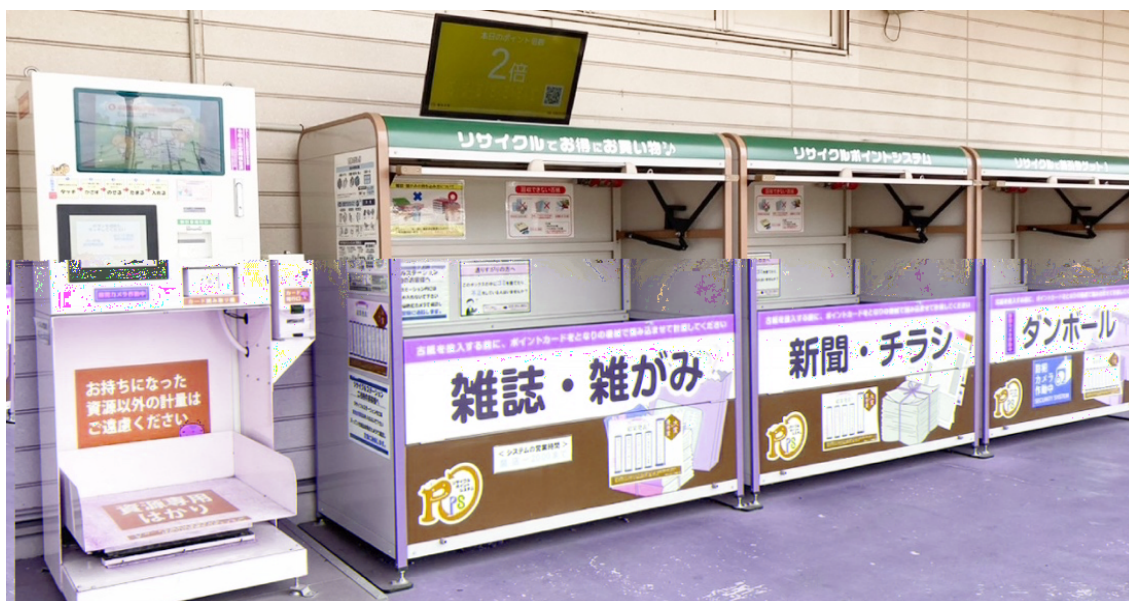
図 3. 資源回収ステーション