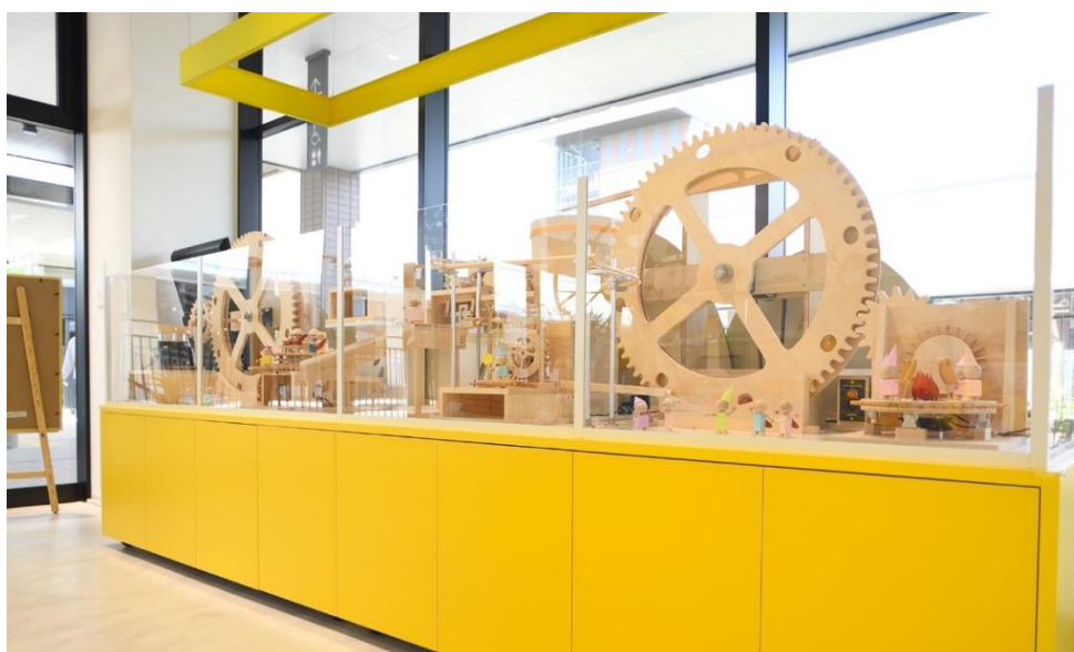
下：かきたねファクトリー