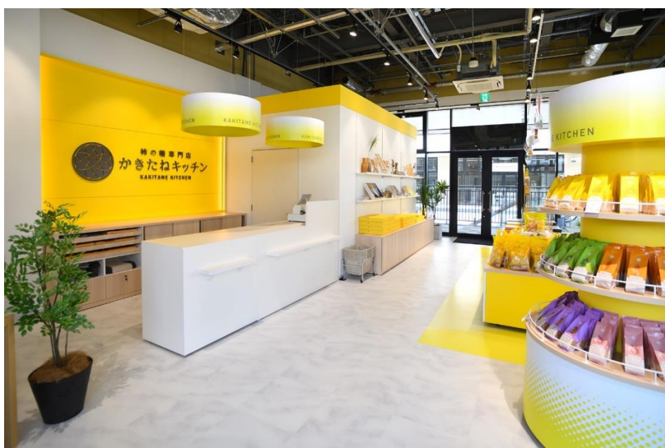
上：かきたねキッチン店内入口

店外には、お米作りから、出来上がったかきたねをお客様に楽しんでいただいているシーンを動くディスプレイ装飾で表現しており、お店の前を通りかかった人を楽しませます。