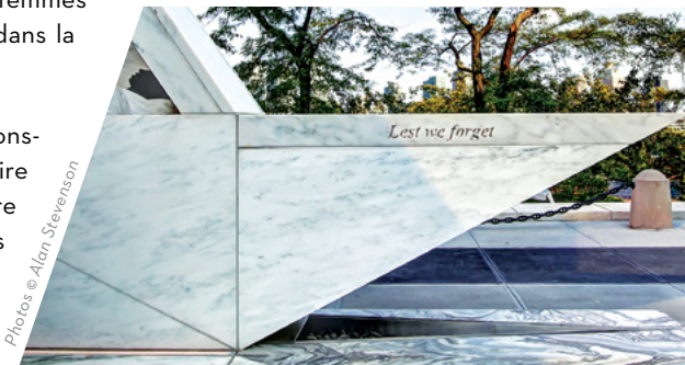
Lest we forget