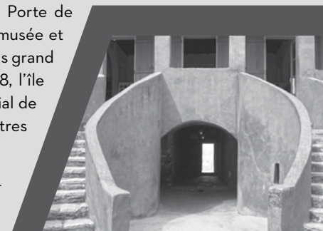
Photo : La Maison des esclaves, l'île de Gorée, Sénégal. © UNESCO/Dominique Roger

Le nom du mémorial, « L'Arche du retour », relève d'un choix délibéré ; il contraste avec la « Porte de non-retour » par laquelle passaient les esclaves africains envoyés vers les Amériques. La Porte de non-retour est située dans la « Maison des esclaves », musée et mémorial sur l'île de Gorée, Sénégal qui aurait été le plus grand centre de traite négrière sur la côte africaine. En 1978, l'île de Gorée a été inscrite sur la liste du patrimoine mondial de l'UNESCO. Elle est là pour rappeler l'exploitation des êtres humains et sert de sanctuaire de la réconciliation.