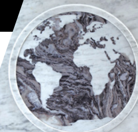
Acknowledge the tragedy

LE TROISIÈME ÉLÉMENT , « Souvenons-nous », est un miroir d'eau triangulaire où les visiteurs peuvent rendre hommage à la mémoire des millions de personnes décédées.