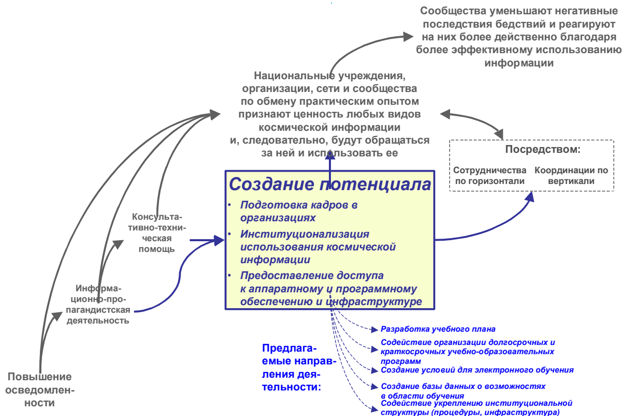
Диаграмма II Мероприятия по созданию потенциала в рамках СПАЙДЕР-ООН

23. На начальном этапе основное внимание будет уделяться повышению осведомленности и разъяснительной работе. Данные мероприятия будут проводиться на международном и региональном уровнях с целью ознакомления с программой СПАЙДЕР-ООН и формирования необходимого числа экспертов и специалистов-практиков в сообществе, занимающемся вопросами предупреждения и ликвидации чрезвычайных ситуаций, и в космическом сообществе. После проведения кампаний по повышению осведомленности и организации практикумов информационно-пропагандистского характера и сопутствующих мероприятий работа продолжится в направлении оказания консультативно-технической поддержки на уровне стран.