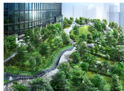
淡路公園のイメージ

ワテラスを囲む緑地は隣接する千代田区立淡路公園と一体的に整備され「神田花暦園」として開放されます。春夏秋冬をテーマにした4つのエリアに季節の樹木や花を整備し、四季を通して旬を感じられる和の庭園空間です。地域の方たちと一緒にガーディングクラブを運営し園内を手入れしながらコミュニティを育てていくことも予定しています。