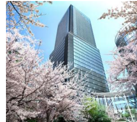
ワテラストワーのイメージ

20～41階がレジデンスエリア。ゲストルームやジムなどの施設も充実し、高層タワーならではの景色の中で暮らすことができる