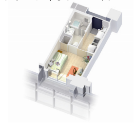
学生マンションのイメージ