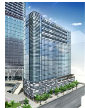
ワテラスアネックスのイメージ

14階～15階は、一般社団法人淡路エリアマネジメントが学生居住推進活動を行う学生専用マンション。学生が地域に根差して居住しつつ、地域活動に積極的に参加する仕組みを提供