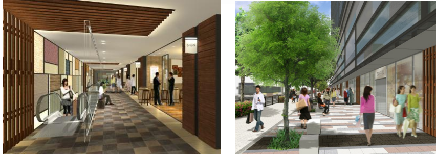
ワテラスモールのイメージ