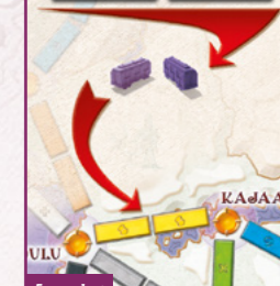
Exemple 1 Pour s'emparer de la route jaune, un joueur doit jouer deux cartes Wagon jaunes.