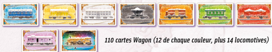
110 cartes Wagon (12 de chaque couleur, plus 14 locomotives)