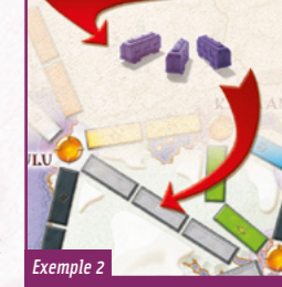
Exemple 2 Pour s'emparer de la route grise, un joueur doit jouer trois cartes Wagon d'une seule et même couleur.