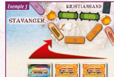
Exemple 3 Pour s'emparer de la ligne de ferries reliant Stavanger à Kristiansand, un joueur doit jouer au moins une locomotive et compléter avec des cartes Wagon orange.