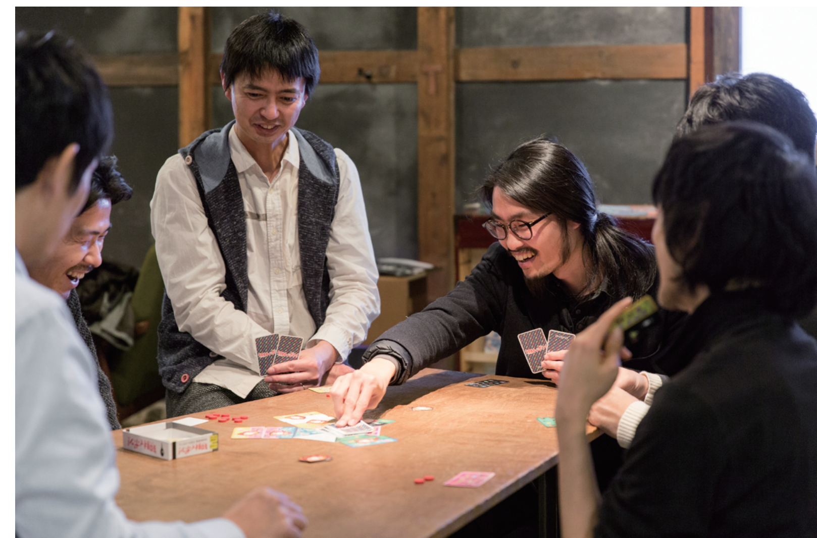
表紙写真：ゲームを用いた研修の様子