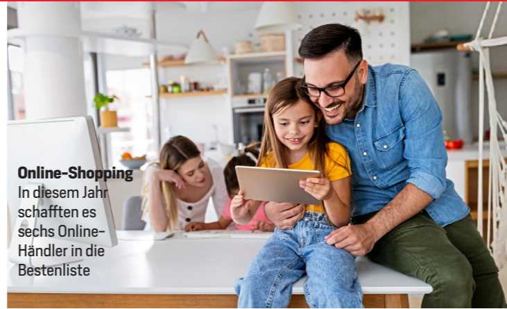
Online-Shopping In diesem Jahr schafften es sechs Online-Händler in die Bestenliste