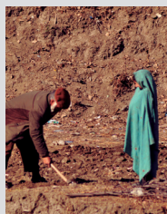
Le Suri Jagek (observation du soleil), pratique météorologique et astronomique traditionnelle fondée sur l'observation du soleil, de la lune et des étoiles par rapport à la topographie locale, Liste de sauvegarde urgente (2018).

Ces systèmes de gouvernance traditionnels renforcent la capacité des communautés à apporter une réponse collective au changement et à construire leur résilience.