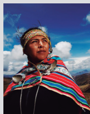
La cosmovision andine des Kallawaya, Liste représentative (2008).

La disparition d'une langue menace la pérennité de la pratique et de la transmission du patrimoine vivant et peut entraîner la perte irrémédiable de savoirs vitaux sur le plan écologique et culturel.