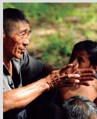
La tradition orale Mapoyo et ses points de référence symboliques dans leur territoire ancestral, Liste de sauvegarde urgente (2014).

Une éducation de qualité pour tous doit exploiter le potentiel de cette ressource précieuse pour renforcer l'estime que la communauté a d'elle-même, se comprendre en tant qu'individu et comprendre la place que chacun occupe dans la société.