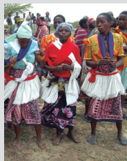
Les traditions et pratiques associées aux Kayas dans les forêts sacrées des Mijikenda, Liste de sauvegarde urgente (2009).

Ces institutions coutumières servent de fondement à la prise de décision relative à la gestion des ressources naturelles, qui peut améliorer la protection de la biodiversité.