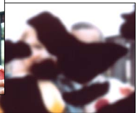
La misma escena vista por una persona con retinopatía diabética.