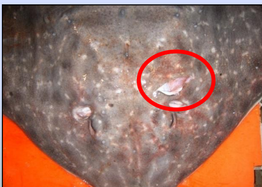
皮膚への軽微なダメージ、 体腔内への貫通なし (4)