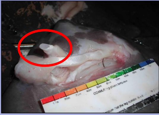
あご骨の損傷(1 or 2)

重度の怪我を負い放流してもその後の生存が期待できない、もしくはすでに死亡したエイ