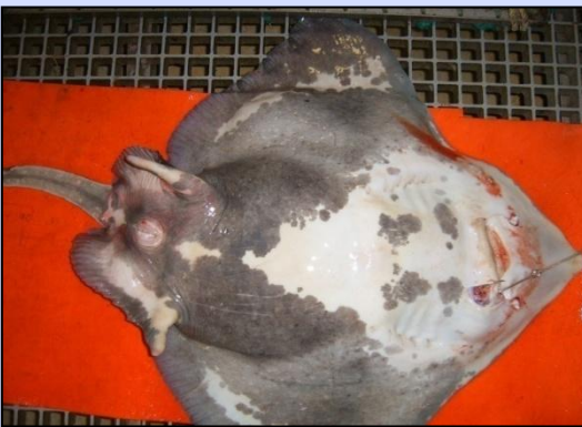
はりによる軽微な怪我のみ、 他の怪我なし (4)