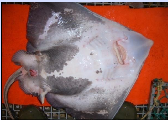
見かけ上ダメージなし(4)