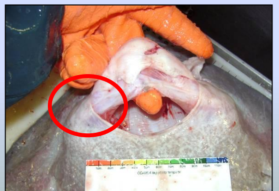
組織の損傷、 あご骨の角の露出なし(3)