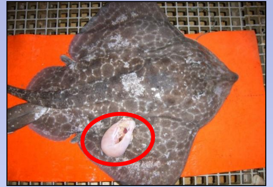
内臓が体腔内から外へ露出(1 or 2)