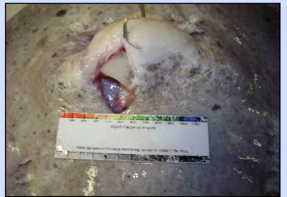
はりによる中程度の怪我(3)