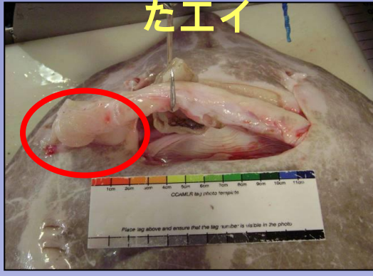
あご骨の露出(1 or 2)