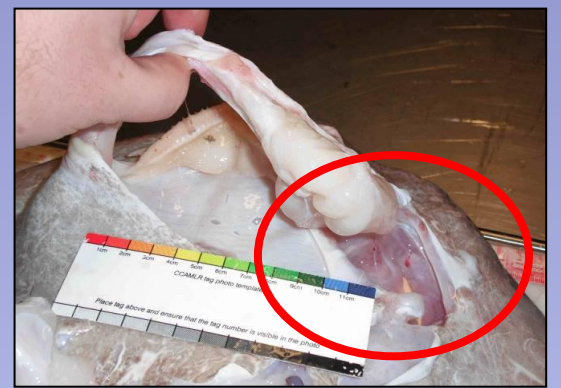
あご骨の角の一部が露出(1 or 2)