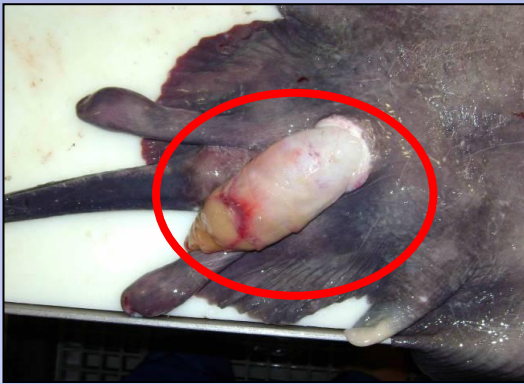
腸の大きな露出(1 or 2)