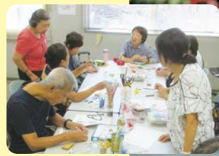
むかしあそび指導者の養成講座で仲間が増えました

最初はまわ事からでも、まずは動いてみて。人と会うことで新しいものが見つかるかも。