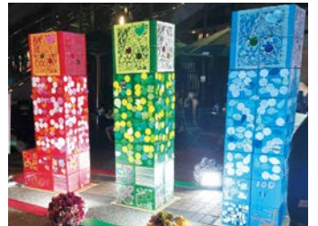
6年8月24日開催のなかはらコアまつりで完成!

「未来の子どもたちのためにも、明るく安全な街であってほしい」「すてきに発展していくまち、応援しています!」「100周年おめでとう。これからも楽しい川崎市であれ~!」「住みやすい町 いつまでも!」