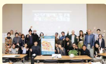
YORIAI(定例会)はいつもにぎやか

地域主体のつながりを作るために、毎月YORIAI(定例会)を開催するなど、仲間づくりや情報発信などを行っています。