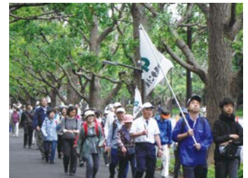
無理せず楽しく歩いてみませんか

📺 区役所地域振興課 ☎044-744-3323 FAX044-744-3346 ※実施の有無は当日6時半から区役所守衛室 ☎044-744-3192 で。事前に区HPを確認した上でご参加ください。