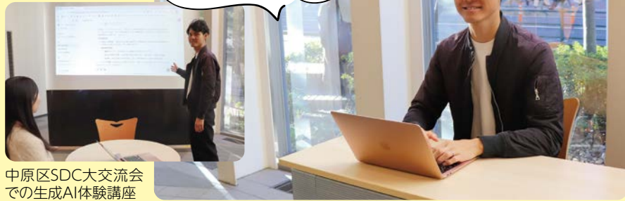
中原区SDC大交流会での生成AI体験講座