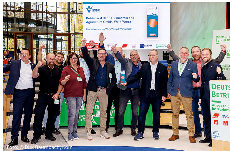
Der Betriebsräte-Preis in Bronze ging an den Betriebsrat des Verbundwerks Werra der K+S (Kali und Salz).