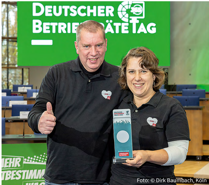
Der Betriebsräte-Preis in Silber 2023 ging an den Betriebsrat der Niederlassung der ZF Friedrichshafen in Ahrweiler.