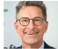
OLIVER MALCHOW ist Polizeibeamter und seit dem 13. Mai 2013 Bundesvorsitzender der Gewerkschaft der Polizei (GdP).

Rund eine Woche nach den brutalen Morden an zwei Polizist*innen im rheinland-pfälzischen Ulmet hat die GdP in einer Resolution einen stärkeren gesellschaftlichen Rückhalt für die Polizei gefordert.