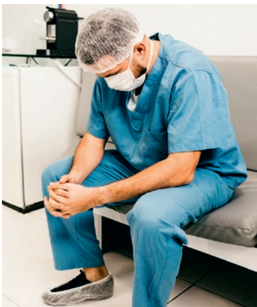
Viele Krankenhäuser waren Mitte Dezember bereits am Limit bei der Versorgung von IntensivpatientInnen.

Er appelliert an die Arbeitgeber, Beschäftigten, die nicht zwingend im Betrieb oder in der Verwaltung anwesend sein müssen, mobiles Arbeiten und Homeoffice zu ermöglichen. Auch dem Arbeitsschutz falle nun eine besondere Bedeutung zu. Schließlich sei nicht in jedem Betrieb Homeoffice und mobiles Arbeiten möglich. „Viele Beschäftigte halten systemrelevante Bereiche im Gesundheitswesen, in der öffentlichen Sicherheit und Verwaltung, in der Wasser- und Energieversorgung, in der Industrie oder im Einzelhandel aufrecht. Beschäftigte, die