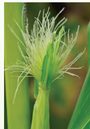
■ Flor femenina.