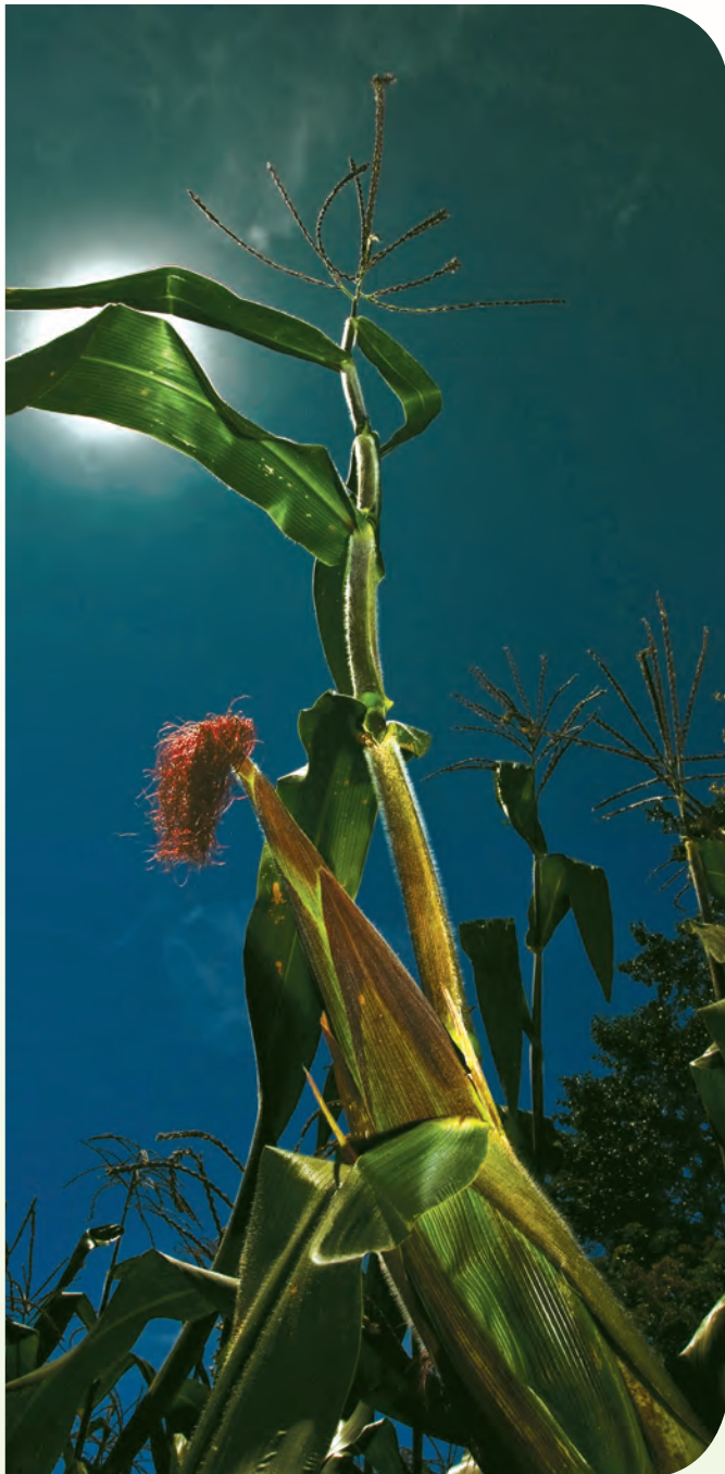
Recuadro 7. Formación de formadores

Poner en marcha programas exitosos de fitomejoramiento participativo requiere capacitación comunitaria al inicio de la intervención, para fortalecer y formar capacidades en los agricultores locales (formación de formadores). Ver recuadro 7.