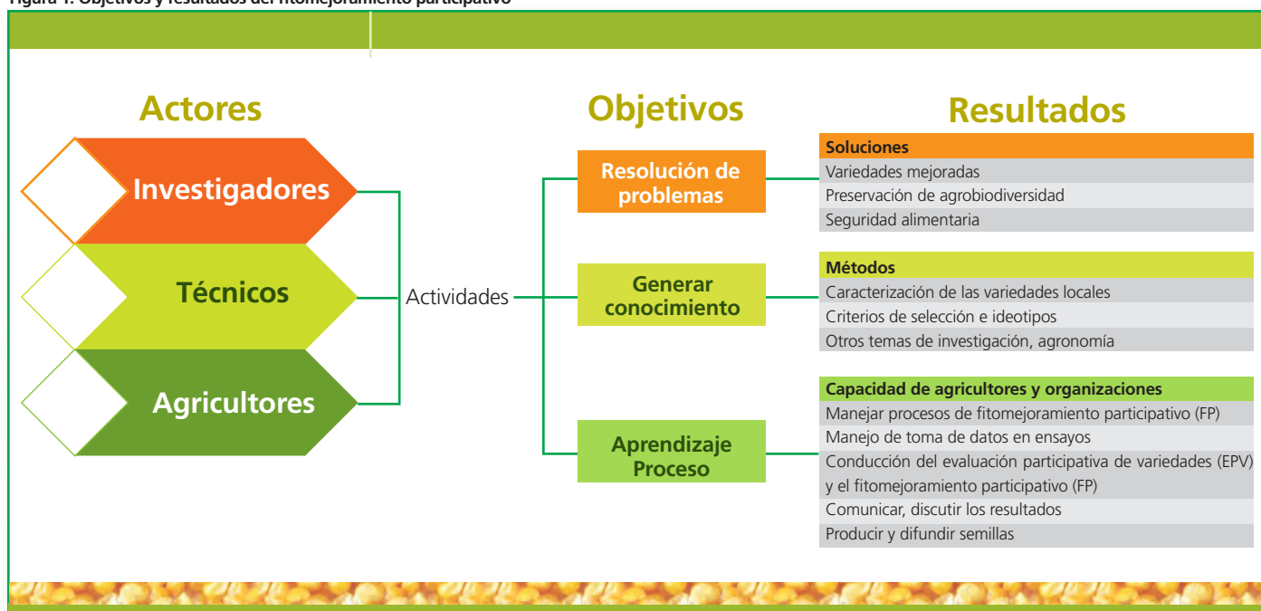
Figura 1. Objetivos y resultados del fitomejoramiento participativo

mas a través del desarrollo de variedades de maíz. El enfoque de estos objetivos se presenta a continuación: