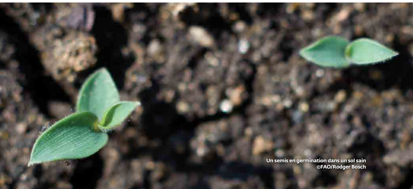
Un semis en germination dans un sol sain

L'agriculture constitue le pilier de l'économie africaine et compte pour approximativement 20% du PIB du continent, 60% de sa main d'œuvre, 20% de la totalité de ses exportations et constitue la principale source de revenu pour les populations rurales de la région.