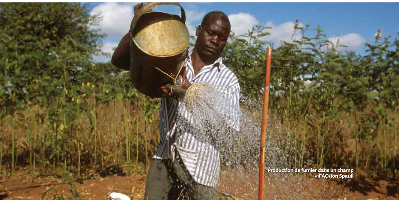
Production de fumier dans un champ

L'utilisation et la gestion durables des écosystèmes terrestres, des forêts, des montagnes, des terres, de la biodiversité et des sols sont bien formulées dans la rédaction de l'ODD 15 et cela est spécifiquement mentionné dans la cible 15.3 qui vise à lutter contre la désertification, à restaurer les terres et les sols dégradés, notamment les terres touchées par la désertification, la sécheresse et les inondations, et à s'efforcer de parvenir à un monde sans dégradation des sols. L'ODD 3 portant sur la bonne santé et le bien-être contient aussi une composante