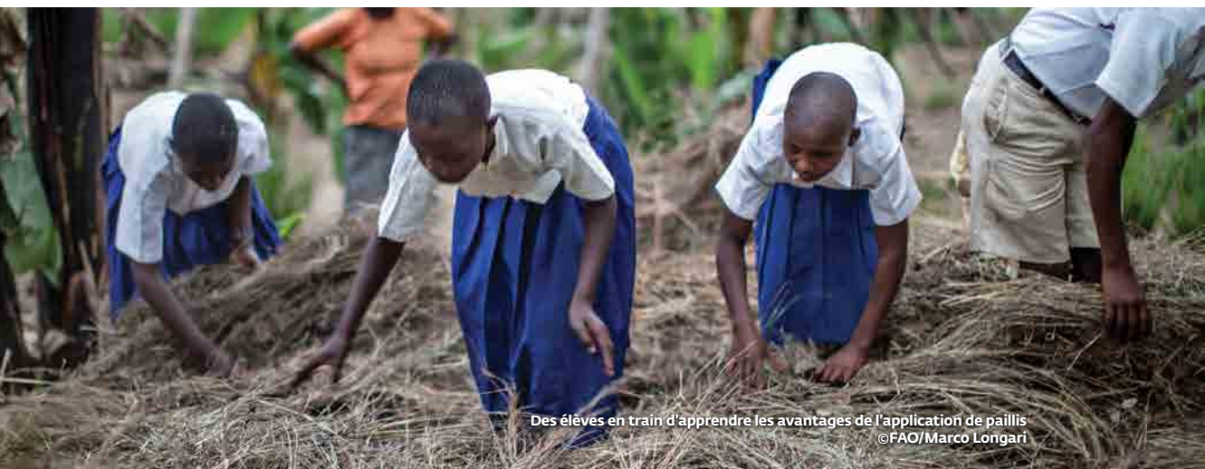
Des élèves en train d'apprendre les avantages de l'application de pailles

L'Objectif 12 portant sur la production et la consommation durables précise dans la cible 12.4 la nécessité “de réaliser une gestion écologiquement rationnelle des produits chimiques et de tous les déchets au long de leur cycle de vie, conformément aux principes directeurs arrêtés à l'échelle internationale et de réduire considérablement leur décharge dans l'air, l'eau et le sol, afin de minimiser leurs effets négatifs sur la santé et l'environnement.