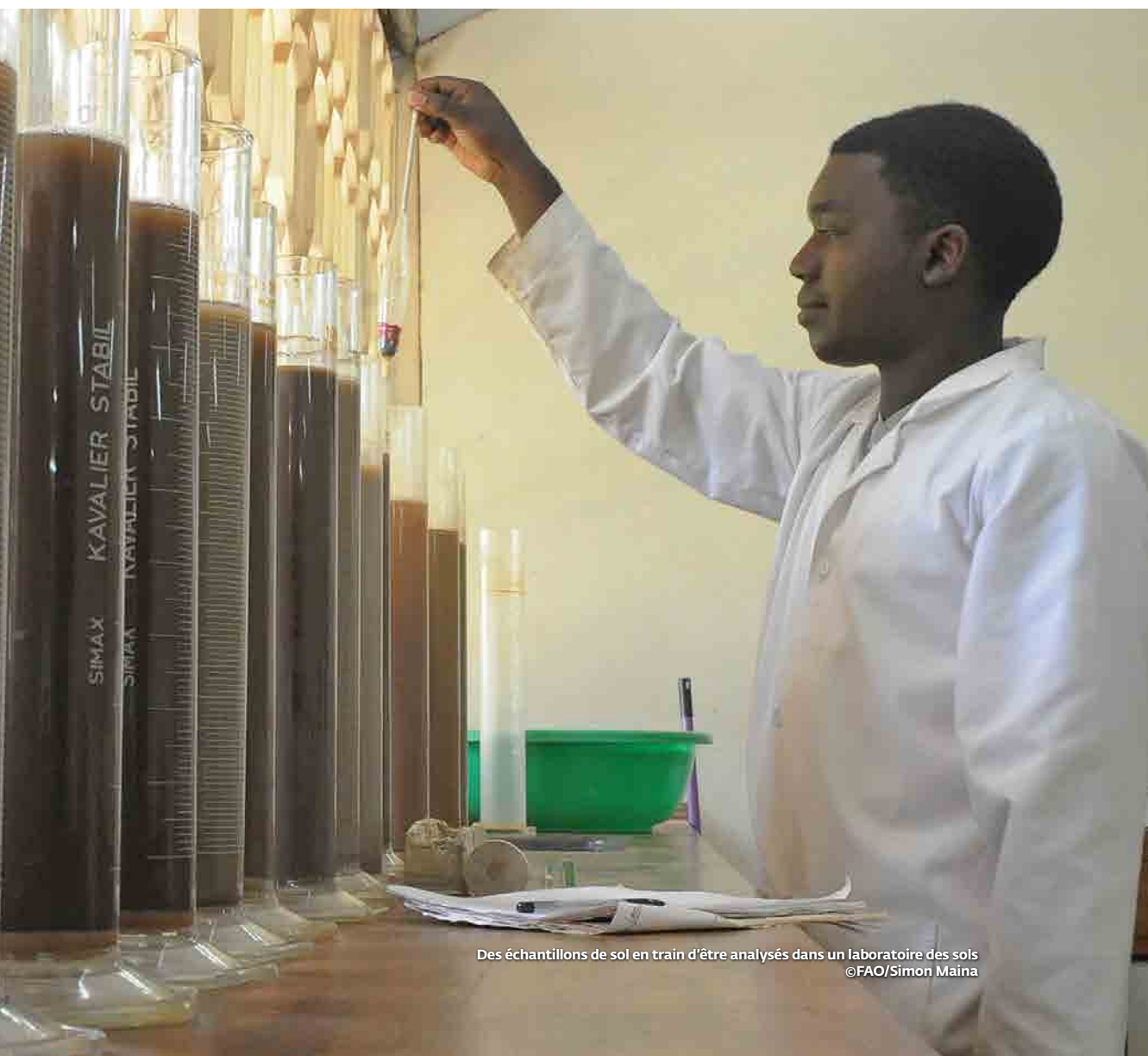
Des échantillons de sol en train d'être analysés dans un laboratoire des sols

Ces objectifs ne peuvent être atteints que dans le cadre d'une approche de gestion durable des sols afin d'assurer que les systèmes édaphiques soient en mesure d'exercer leurs fonctions naturelles et fournir les services écosystémiques qui sont indispensables pour le développement durable en Afrique.