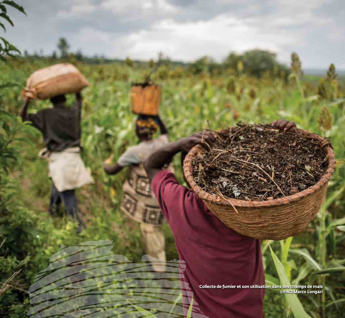
Collecte de fumier et son utilisation dans des champs de maïs

Cette brochure a été préparée par l'Organisation des Nations Unies pour l'Alimentation et l'Agriculture avec le soutien du Partenariat mondial sur les sols.