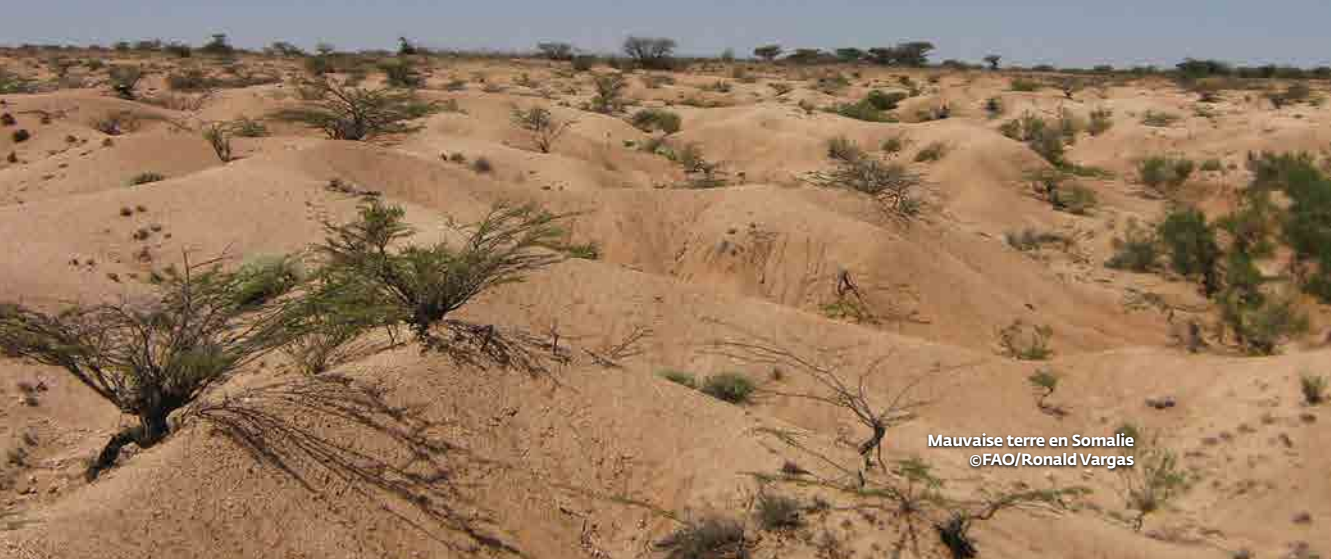
Mauvaise terre en Somalie