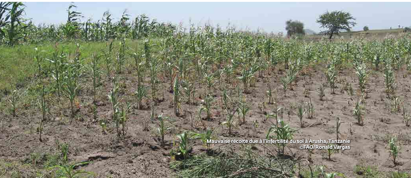
Mauvaise récolte due à l'infertilité du sol à Arusha, Tanzanie

Afin d'atteindre les objectifs de croissance agricole et d'élimination de la faim et de la pauvreté fixés dans la déclaration de Malabo, le cadre PDDAA et les Objectifs de développement durable (ODD) récemment adoptés par les Nations Unies, il est nécessaire d'améliorer de manière significative la productivité des sols africains qui sont présentement gravement dégradés.