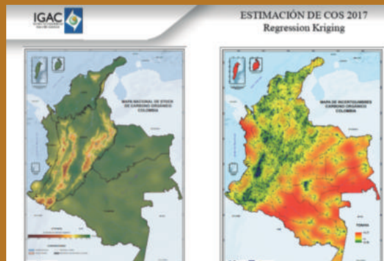
Taller subregional de mapeo digital de suelos. Ejemplo: Mapa de Carbono Orgánico del Suelo de Colombia y mapa de incertidumbre.