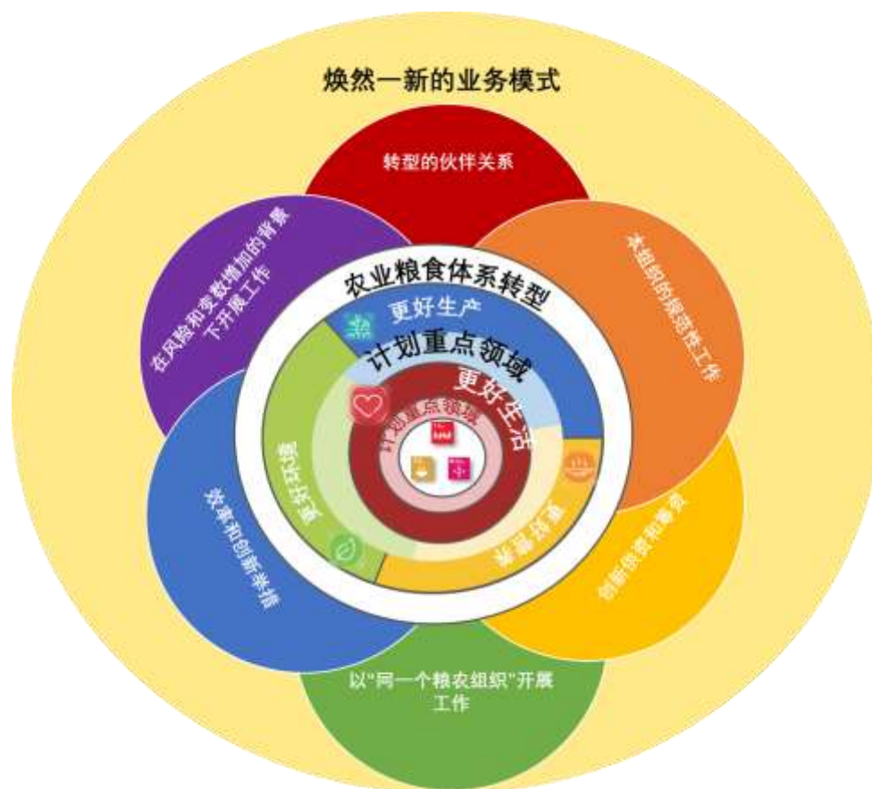
图 6：本组织契合目的、焕然一新的业务模式