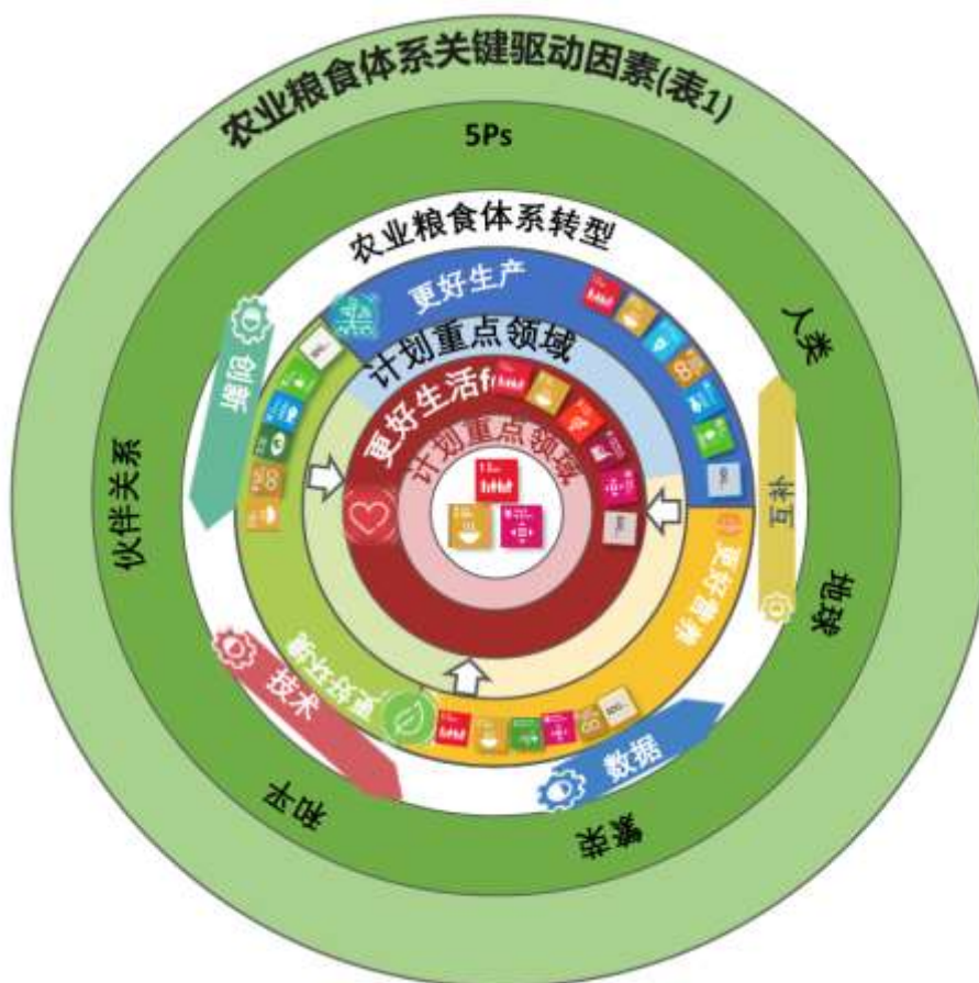
图 4：本组织战略结果框架的主要要素