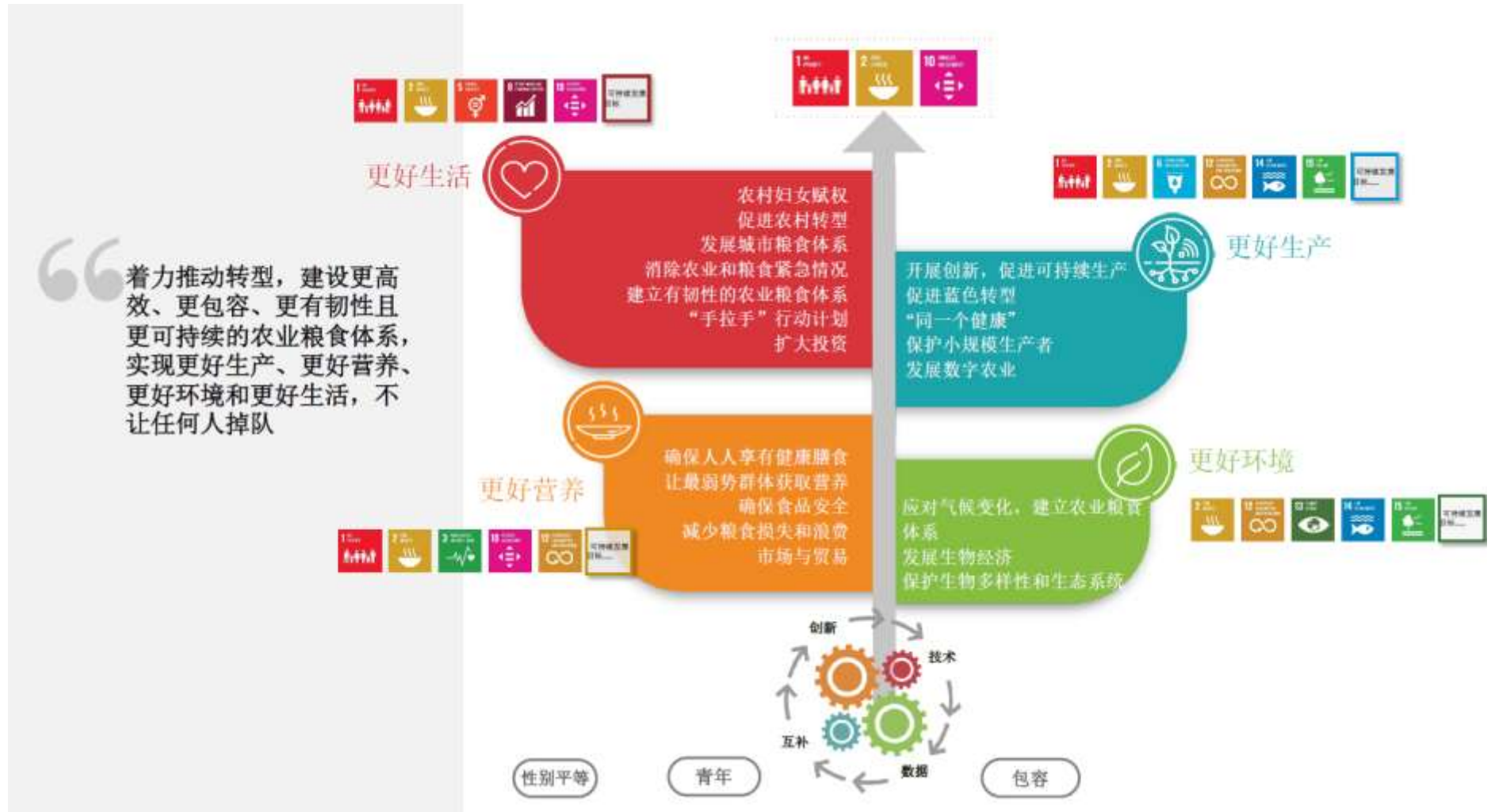
图 5：粮农组织战略结果框架