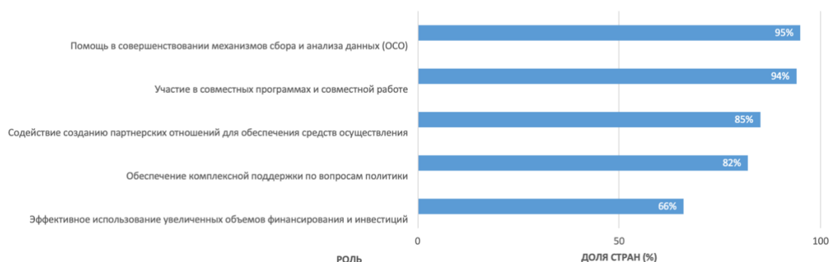
РИСУНОК 2. РОЛЬ ФАО В РАЗВИТИИ РАМОЧНОЙ ПРОГРАММЫ СОТРУДНИЧЕСТВА ООН