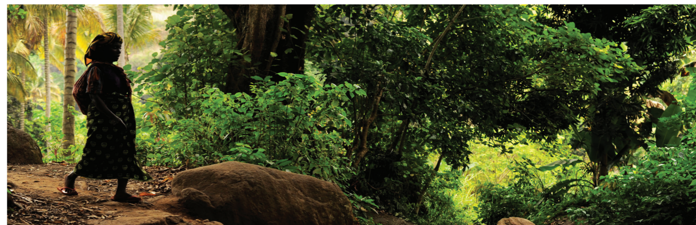
Une femme traverse un des nombreux cours d'eau relié à un canal d'irrigation utilisé pour une agriculture intelligente face aux changements climatiques en Tanzanie.

Organisation des Nations Unies pour l'alimentation et l'agriculture