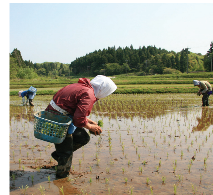
Aménagement durable des paysages à Satoyama-Satoumi au Japon pour renforcer la capacité d'adaptation au changement climatique.

de conservation des sols devraient permettre de réduire les émissions de gaz à effet de serre provenant de l'agriculture, d'améliorer la séquestration du carbone et de renforcer la résilience au changement climatique.