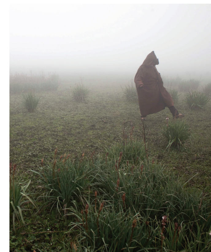
Un villageois en train de marcher dans une tourbière en Tunisie.