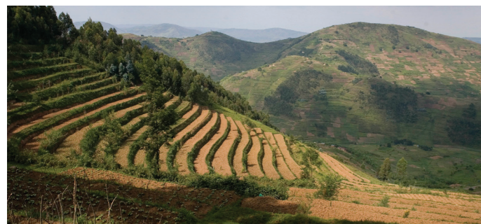
Les collines en terrasses aident les sols à retenir l'eau et à prévenir l'érosion.