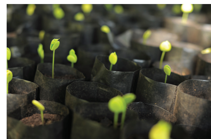
Des semis de moringa dans une pépinière. L'arbre de moringa joue un rôle très important pour atténuer le changement climatique et augmenter les revenus des paysans pauvres en Afrique.