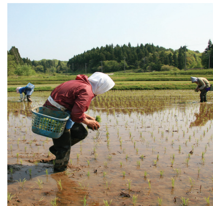
日本里山-里海地景可持续管理能够抵御气候变化的影响。