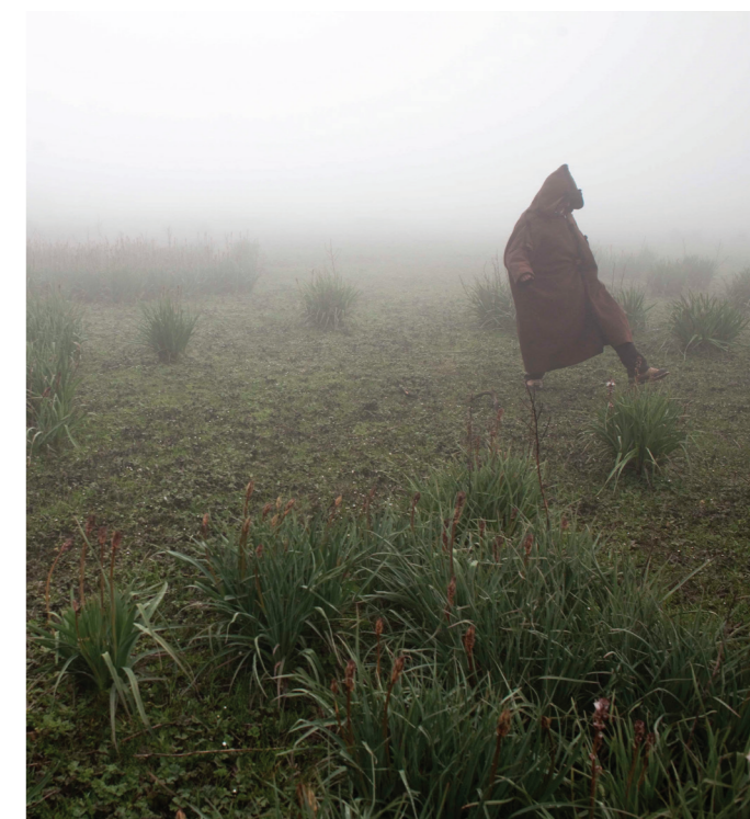
突尼斯一名村民在泥炭沼泽地里行走。

气候变化不仅影响土壤，而且严重威胁着全球粮食安全。温度和降雨模式的变化可能对有机物和土壤过程及依赖它们生存的植物和作物造成巨大影响。为了应对全球粮食安全和气候变化的挑战，必须从根本上改变农业和土地管理办法。改进农业和土壤管理实践以增加土壤有机碳的方法，如农业生态学、有机农业、保护性农业和农林业，能够带来多重效益。这类生产方式使土壤肥沃，富含有机质（碳），保持土表植被，需要较少化学投入物，而且促进作物轮作和生物多样性。这种土壤也不太容易受到侵蚀和荒漠化影响，能够维持重要的生态系统服务，如水和养分循环，而这些都是保持和增加粮食产量的重要因素。粮农组织还推广一种被称为“气候智能型农业”的统一方法，为支持其成员国在气候变化条件下实现粮食安全而创造技术、政策和投资条件。“气候智能型农业”方法有助于持续提高生产力和抵御气候变化的能力（适应），并在可能的情况下，减少和消除温室气体（减缓）。