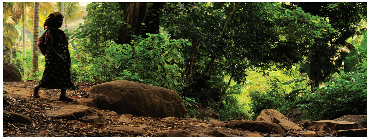
坦桑尼亚一名妇女穿行于溪流之间，后者为气候智能型农业模式下的一个灌溉渠道提供水源。