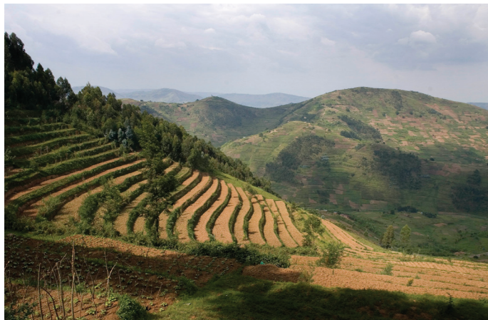
一幅梯田景观。梯田有助于土壤保持水分和防止土壤侵蚀。