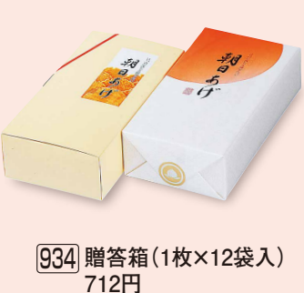
934 贈答箱 (1枚×12袋入) 712円