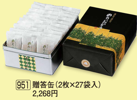
951 贈答缶 (2枚×27袋入) 2,268円