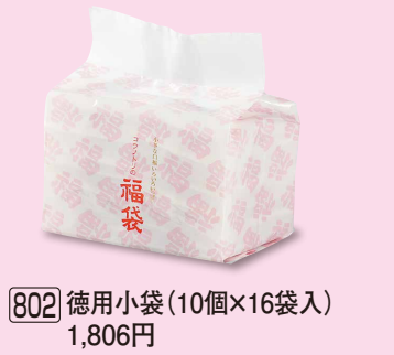
802 徳用小袋 (10個×16袋入) 1,806円