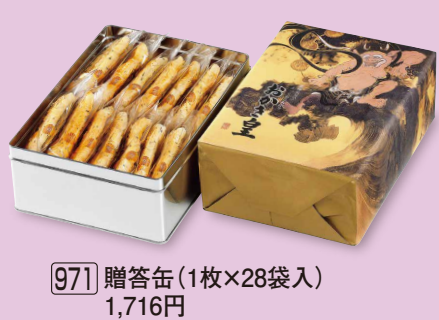
971 贈答缶 (1枚×28袋入) 1,716円