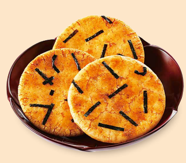
はりま焼 味はなんなりと豆腐せんべい