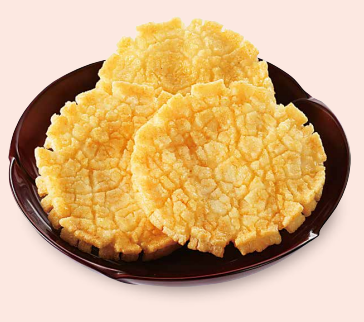
朝日あけ ほつべた落ちる揚げせんべい