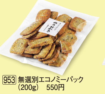
953 無選別エコミーパック (200g) 550円