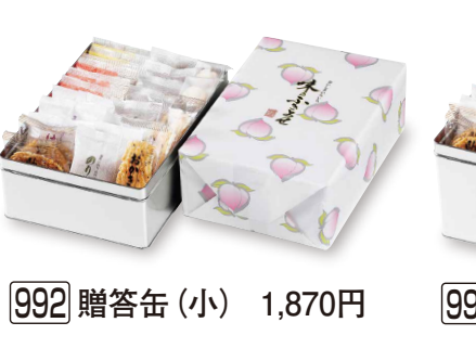
992 贈答缶 (小) 1,870円