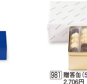
981 贈答缶 (5個×24袋入) 2,706円