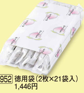
952 徳用袋 (2枚×21袋入) 1,446円