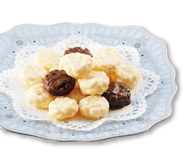
ユーロの星 チョコレートな一口揚せん