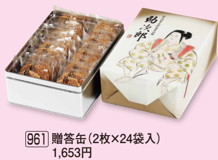
961 贈答缶 (2枚×24袋入) 1,653円