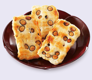
おやしもち 丹波黒大豆入り