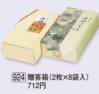
924 贈答箱 (2枚×8袋入) 712円