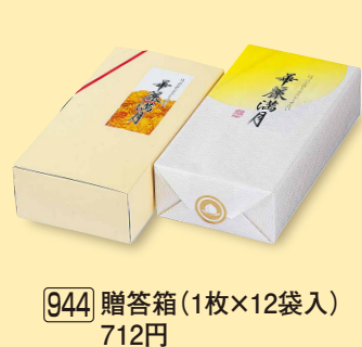
944 贈答箱 (1枚×12袋入) 712円