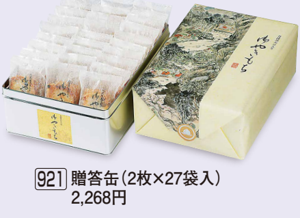
921 贈答缶 (2枚×27袋入) 2,268円