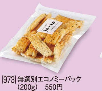
973 無選別エコミーパック (200g) 550円