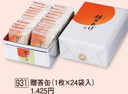
931 贈答缶 (1枚×24袋入) 1,425円