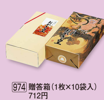
974 贈答箱 (1枚×10袋入) 712円