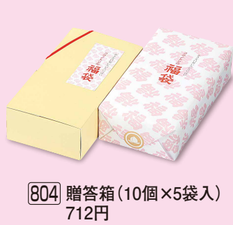
804 贈答箱 (10個×5袋入) 712円