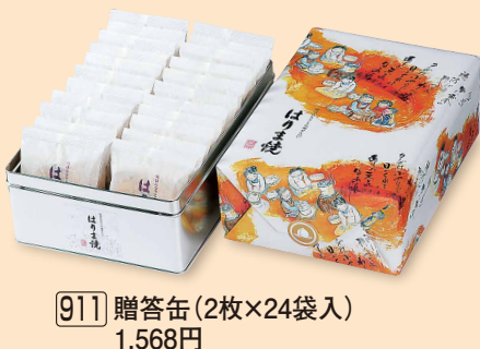
911 贈答缶 (2枚×24袋入) 1,568円