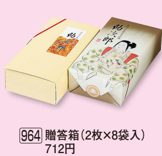
964 贈答箱 (2枚×8袋入) 712円