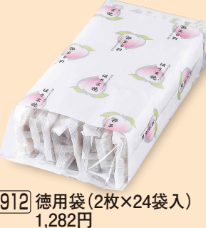
912 徳用袋 (2枚×24袋入) 1,282円