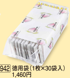
942 徳用袋 (1枚×30袋入) 1,460円