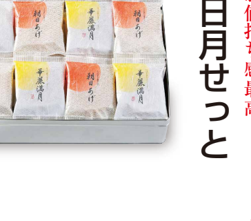
お値打ち感最高 日月せつと