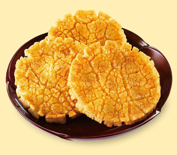
華麗満月 ほつべた落ちるカレー揚げせん