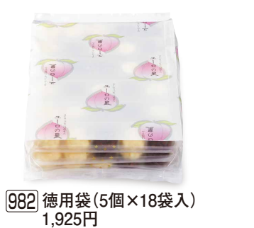
982 徳用袋 (5個×18袋入) 1,925円