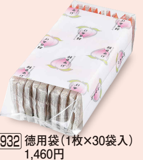
932 徳用袋 (1枚×30袋入) 1,460円