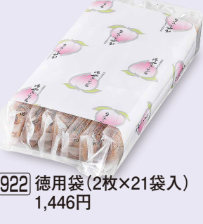
922 徳用袋 (2枚×21袋入) 1,446円