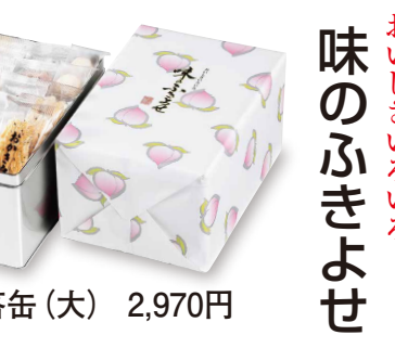
味のふきよせ おいしいいろいろ