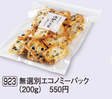
923 無選別エコミーパック (200g) 550円