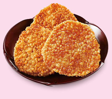
助次郎 おこげさんおにぎりの味