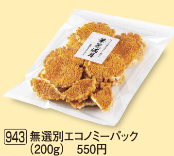
943 無選別エコミーパック (200g) 550円