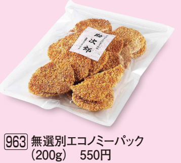
963 無選別エコミーパック (200g) 550円