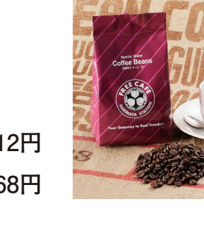
192 挽売り (300g) 768円