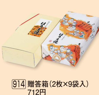
914 贈答箱 (2枚×9袋入) 712円