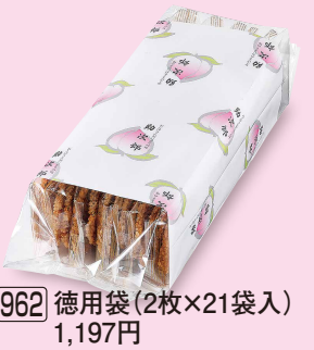
962 徳用袋 (2枚×21袋入) 1,197円