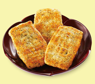
のりおかき 海のいのち山のいのち