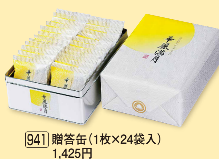
941 贈答缶 (1枚×24袋入) 1,425円