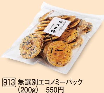
913 無選別エコミーパック (200g) 550円