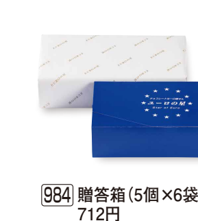
984 贈答箱 (5個×6袋入) 712円