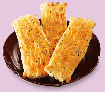
おかき皇 ふつくしんがり雷神火力