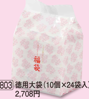
803 徳用大袋 (10個×24袋入) 2,708円