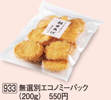
933 無選別エコミーパック (200g) 550円