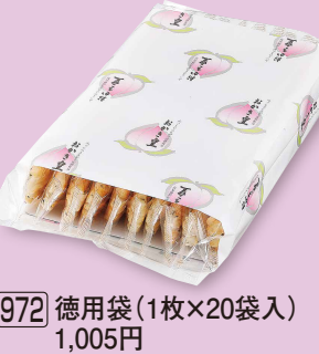
972 徳用袋 (1枚×20袋入) 1,005円