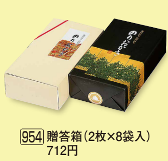
954 贈答箱 (2枚×8袋入) 712円