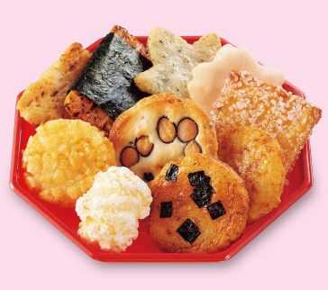
コウノトリの福袋 小さな口福いろいろ