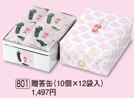
801 贈答缶 (10個×12袋入) 1,497円