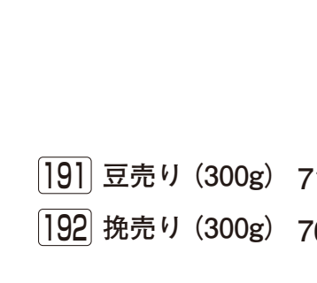
191 豆売り (300g) 712円