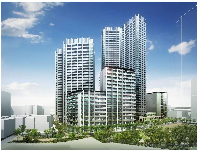
【建物外観完成予想CG】

今後も、権利者の皆様とともに、2027年の竣工を目指し事業を推進してまいります。