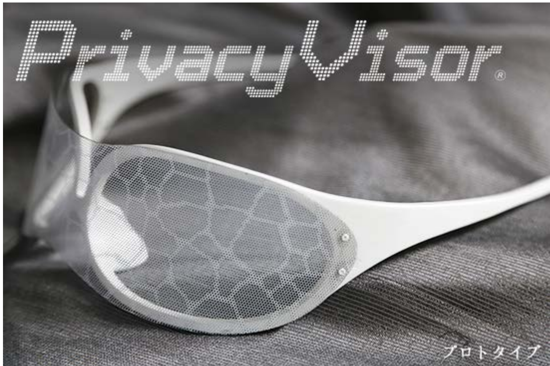
(図1) 3Dプリンターで印刷した樹脂フレームによる「プライバシーバイザー」の試作品 (安藤 毅氏, 片方 聡氏デザイン)