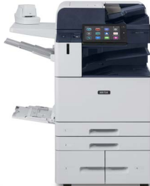
Imprimanta multifuncțională color Xerox® AltaLink® C8130/ C8135/C8145/ C8155/C8170