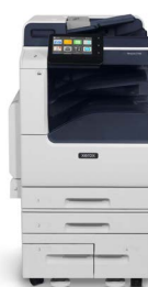
Imprimanta multifuncțională color Xerox® VersaLink® C7120/C7125/ C7130