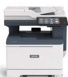
Imprimanta multifuncțională color Xerox® VersaLink® C415