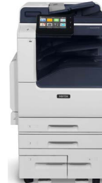
Imprimanta multifuncțională Xerox® VersaLink® B7125/B7130/ B7135