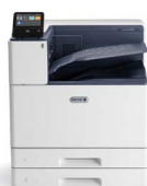
Imprimanta color Xerox® VersaLink® C8000