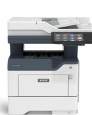
Imprimanta multifuncțională Xerox® VersaLink® B415