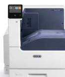
Imprimanta color Xerox® VersaLink® C7000