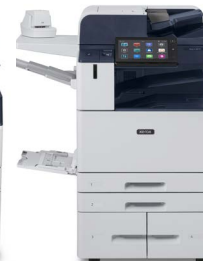
Imprimanta multifuncțională Xerox® AltaLink® B8145/B8155/ B8170

* Produsul nu este disponibil în toate zonele geografice; vă rugăm să contactați reprezentantul dvs. de vânzări.