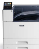
Imprimanta color Xerox® VersaLink® C9000