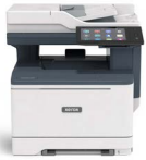
Xerox® VersaLink® C415- värimonitoimitulostin