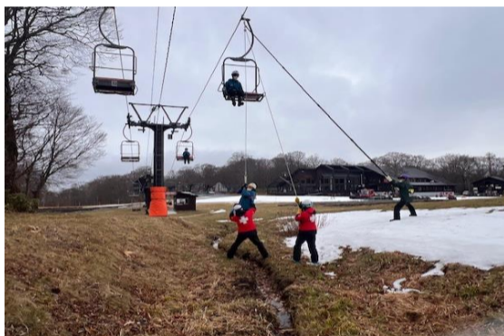
【冬季シーズン前救助訓練】