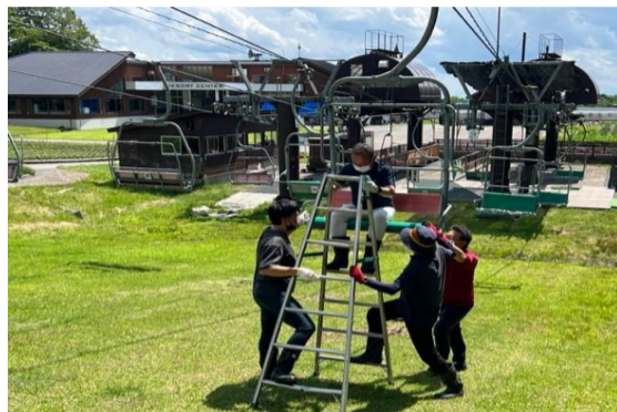
【夏季シーズン前救助訓練】