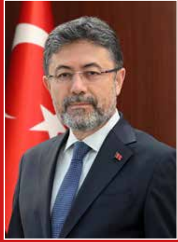
İbrahim YUMAKLI Tarım ve Orman Bakanı

Yol haritamızı oluştururken Sayın Cumhurbaşkanımızın sıklıkla ifade ettiği “Güçlü Türkiye’nin yolu güçlü tarımdan geçer.” sözünü şiar edindik. Türkiye Yüzyılı’nda tarımı; verimliliğin, kalitenin, sağlığın, sürdürülebilirliğin, rekabet edebilirliğin zirvesine çıkarmak için var gücümüzle çaba sarf etmeye devam edeceğiz.