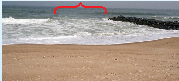
Con frecuencia la corriente marina se origina cerca de estructuras costeras.