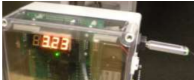
Tiempo restante para la culminación de descarga de datos