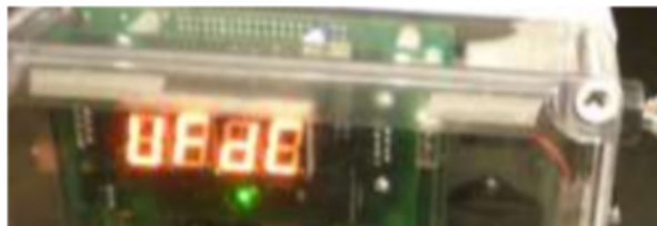
Culminación de descarga de datos